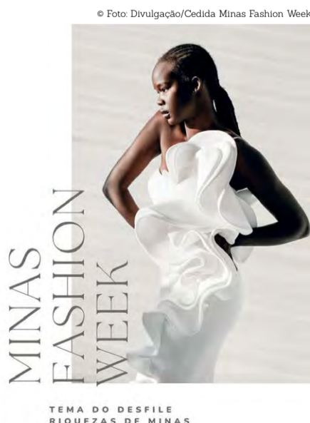
“Riquezas de Minas”: O Minas Fashion Week acontece no Mercado de Origem

Com o tema voltado para “Riquezas de Minas”, será realizado no dia 25 de maio o Minas Fashion Week, evento que terá lugar no Mercado de Origem, apresentando coleções que investem no artesanato e que valorizam os processos manuais, trazendo o DNA da moda mineira e a identidade cultural.