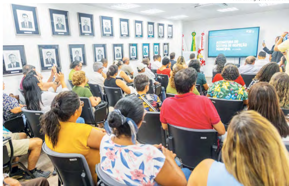
Apresentação: A Prefeitura apresentou os novos procedimentos de inspeção sanitária e industrial dos produtos de origem animal

Entre os benefícios trazidos por esta inspeção à população estão a segurança alimentar através da fiscalização e a inspeção garantindo que os alimentos de origem animal sejam produzidos e comercializados de acordo com normas sanitárias, reduzindo o risco de contaminações e doenças alimentares. Também, a qualidade dos alimentos por meio da padronização e a inspeção, os consumidores podem ter mais confiança na qualidade dos produtos que estão adquirindo, sabendo que eles atendem