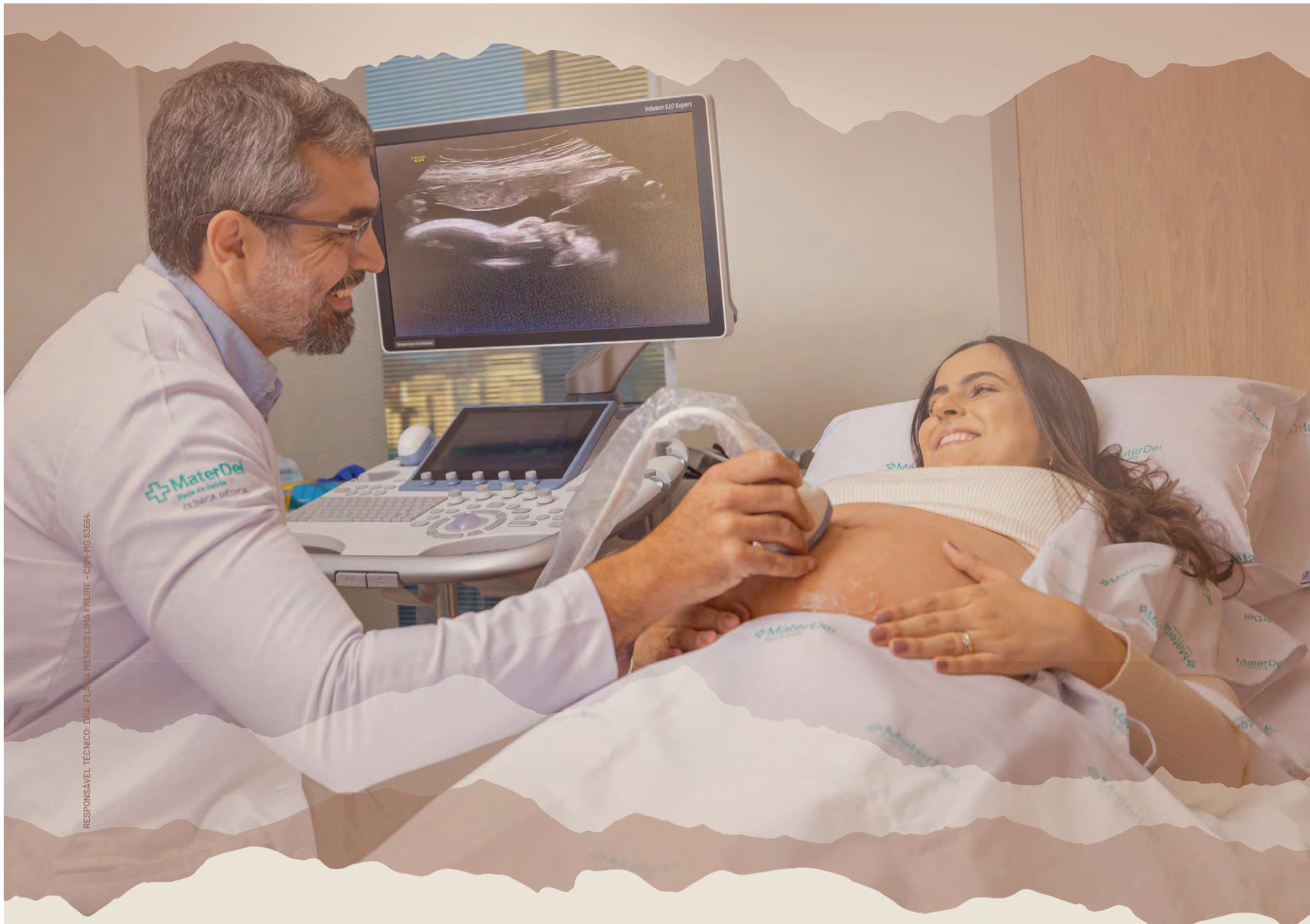
RESPONSÁVEL TÉCNICO: DRA. FLÁVIA MENDES LIMA FREIRE - CRM-MG 83884.