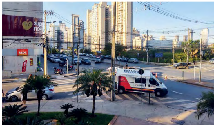
Policiamento: A Base Móvel no Vila da Serra vai potencializar as operações em outras regiões

A medida, que visa ampliar o alcance do policiamento ostensivo e promover um contato mais direto entre os policiais e os moradores, não afetará o serviço habitual da base, que continuará operando normalmente. Segundo a instituição, o intuito é aprimorar a utilização dos recursos disponíveis,