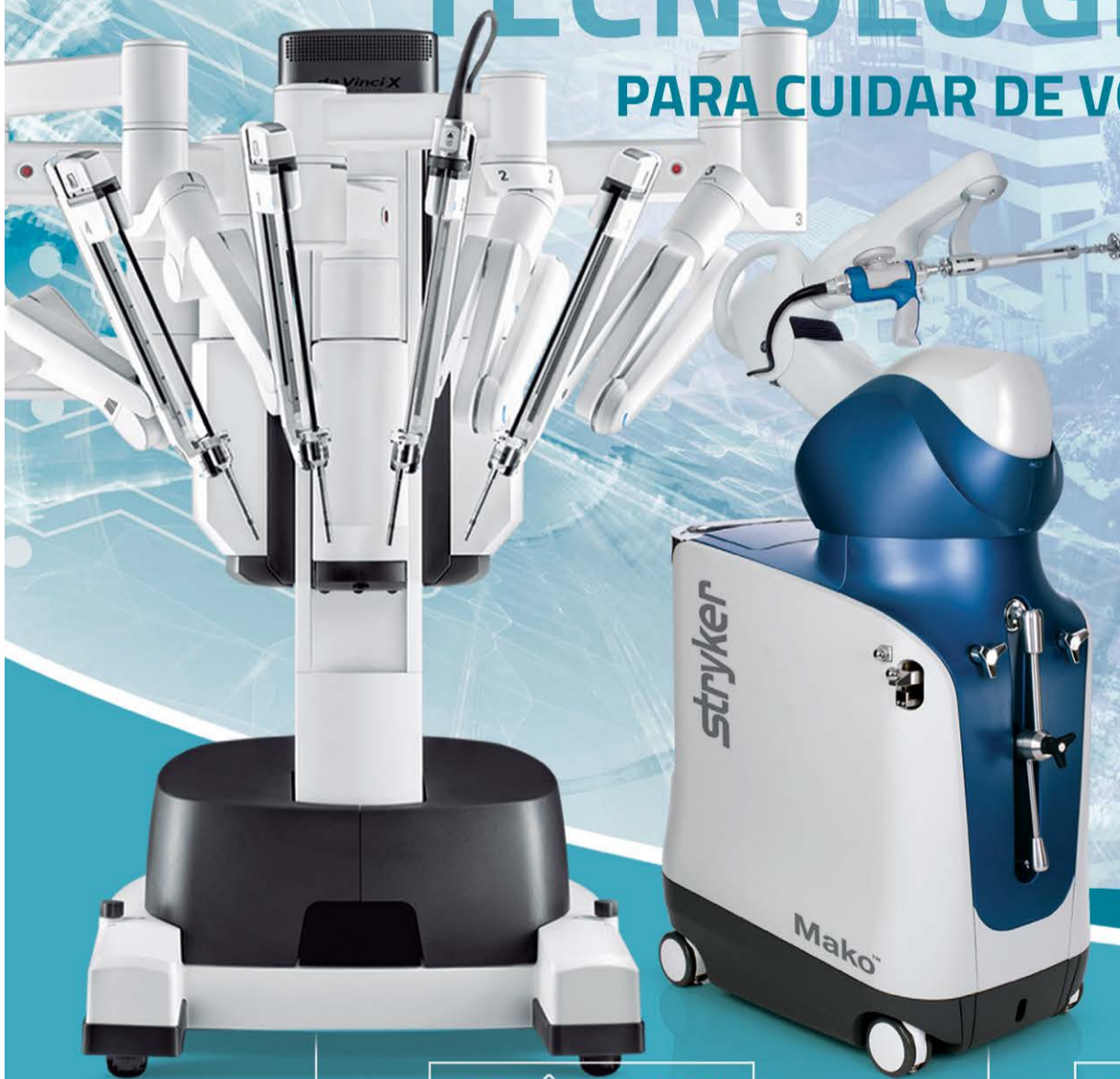
ROBÔ DA VINCI