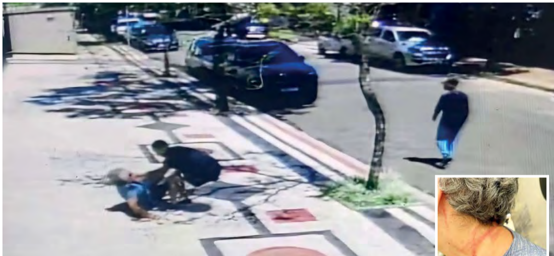
A luz do dia: No último dia 7 de março, às câmeras de um edifício flagraram o momento em que uma senhora de 67 anos foi assaltada e agredida

Procurada pelo JORNAL BELVEDERE, a Polícia Militar de Minas Gerais (PMMG), por intermédio do 22º BPM, informou que acompanha todos os fatos policiais