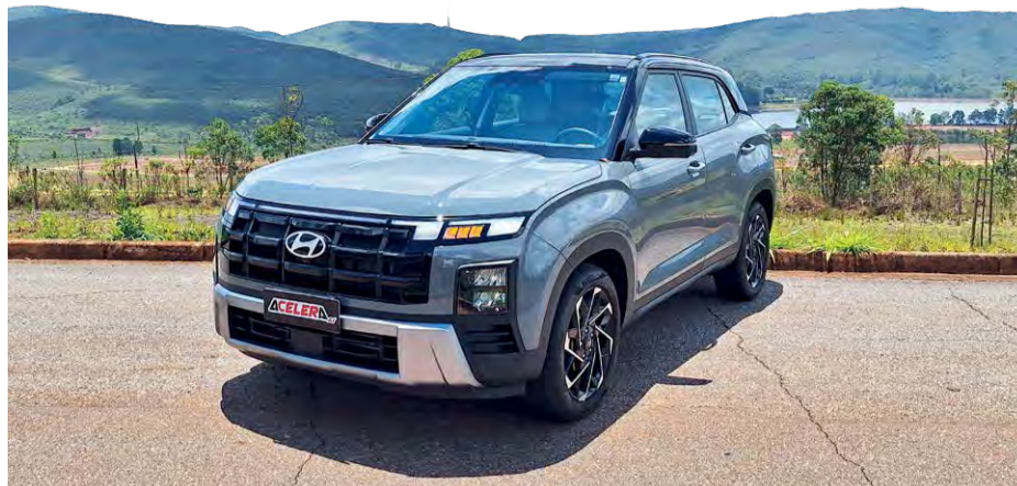
Novo visual: No Hyundai Creta, destaque para a grande dianteira em preto brilhante e faróis totalmente em LED

Em termos de conforto, o Hyundai Creta Ultimate traz itens como ar-condicionado automático digital de duas zonas e com saída para o banco traseiro; banco do motorista com ventilação, carregador de celular por indução e teto solar panorâmico. Entre os itens de assistência à condução, destaque para o assistente de ponto cego, assistente de tráfego cruzado traseiro, alerta de saída segura, controle de velocidade adaptativo e sistema de alerta e frenagem au-