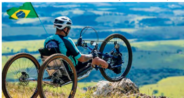
Trilhas para Todos: O projeto também vai oferecer hand bikes e triciclos acessíveis