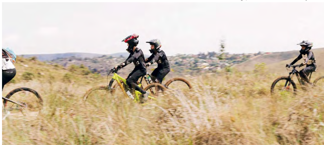
© Foto: Divulgação/Frank Bitencourt/Cedida Projeto Trilhas Projeto Trilhas: Há mais de 10 anos promove a conservação e a revitalização de trilhas em Minas

Para 2025, estão previstas cinco inaugurações de rotas e caminhos que compõem o Circuito Vale de Trilhas em Nova Lima, que constituirão novas alternativas para o Projeto Trilhas para Todos. Assim, com trilhas revigoradas e equipamentos para garantir a acessibilidade, nenhum obstáculo será grande demais.